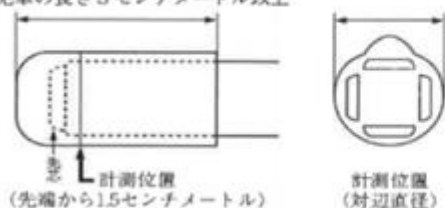
<ちくとうの最小直径値の計測方法>